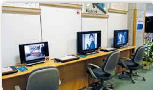
ふるさとの文人コーナー